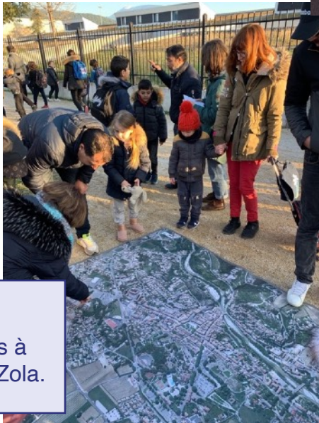
Ici, on discute avec les parents d'élèves à la sortie de l'école Zola.