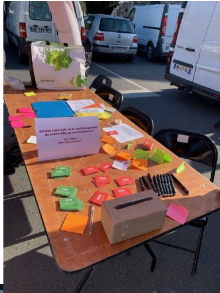
Ici, on propose aux habitants de donner leur avis sur la participation citoyenne.