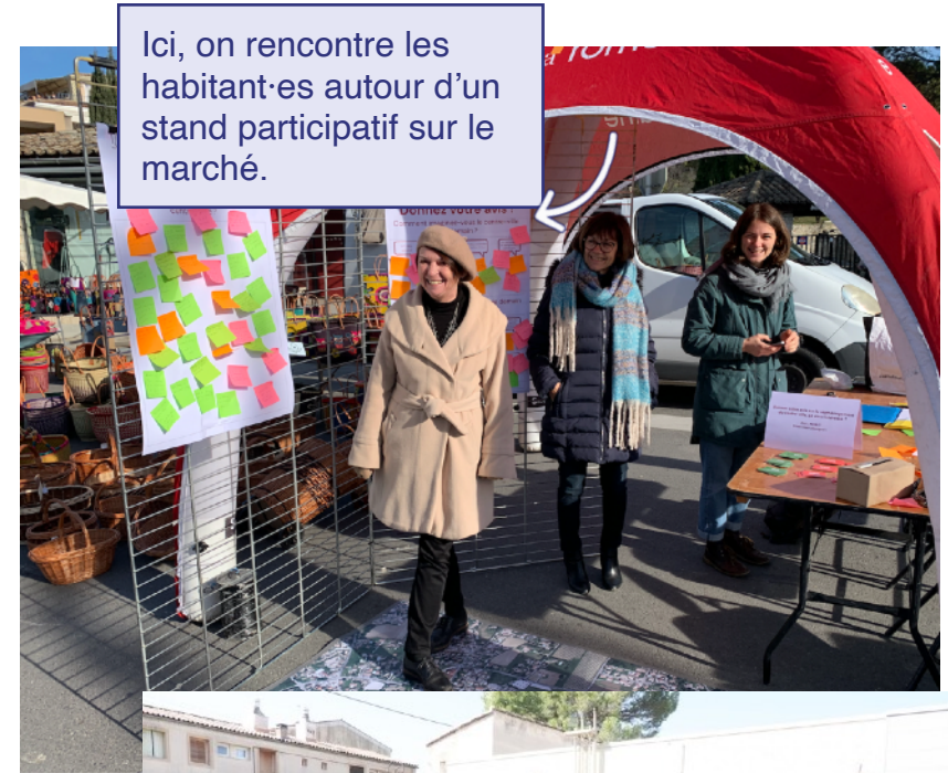
Ici, on rencontre les habitant-es autour d'un stand participatif sur le marché.