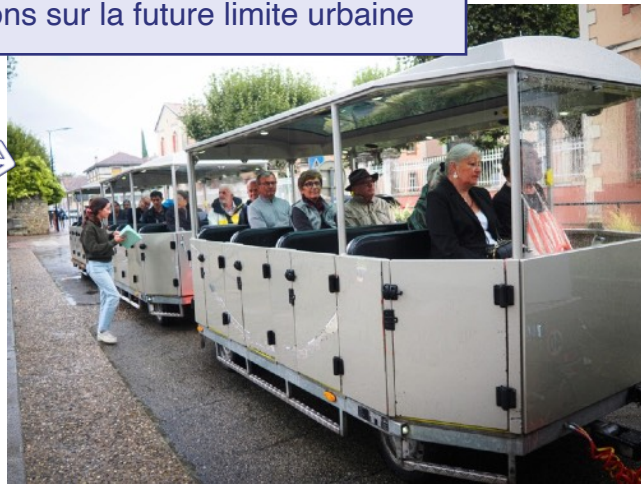
Ici, on associe les habitants aux réflexions sur la future limite urbaine