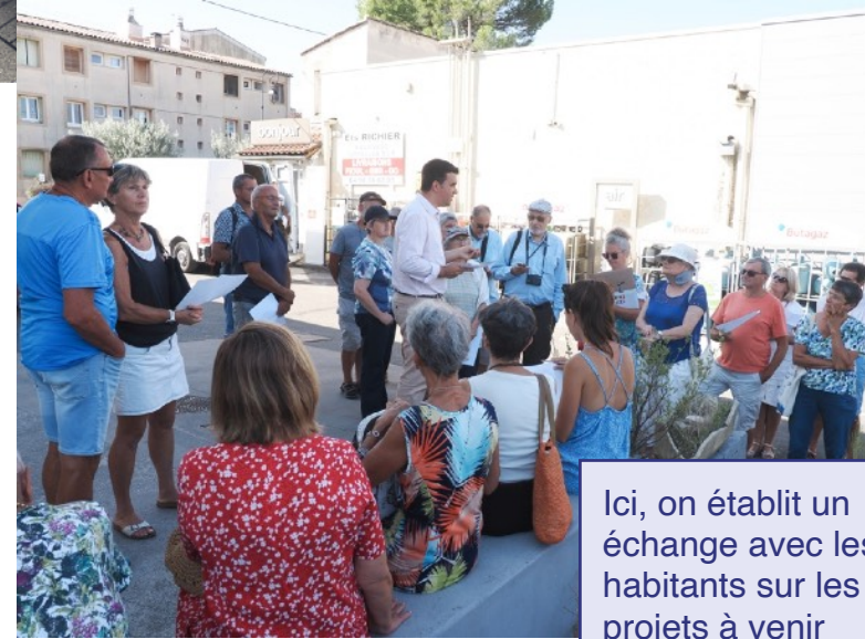
Ici, on établit un échange avec les habitants sur les projets à venir