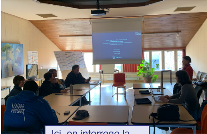
Ici, on interroge la participation citoyenne avec le groupe mixte.